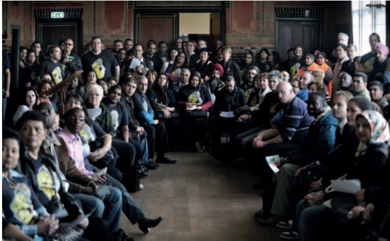
Het parlement van schoonmakers in De Burcht in Amsterdam, courtesy Maathijs de Bruijne, foto Joost van den Broek

zich krachtiger verhoudt tot de kwesties die nu leven in Nederland.'